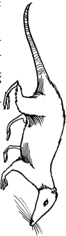
Megazostrodon (10 cm)

Denna lilla näbbmusliknande varelse var ett av de första däggdjuren. Den levde från slutet av Trias till en bit in i Jura. Den lade troligen ägg liksom reptilerna, men hade i övrigt en helt annan kroppsbyggnad.