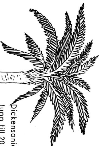
Dickensonia (upp till 20 m)

Araucarioxylon var ett av dessa och bildade stora skogar.